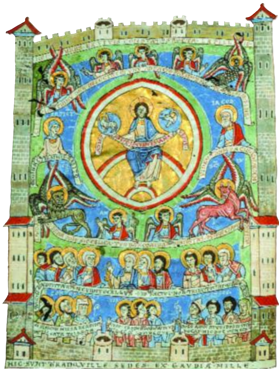
Manuscris din castelul Hradcany, Praga, înfățișându-L pe Cristos care domnește în Ierusalimul ceresc.

glosar pentru a-i ajuta pe cei care nu sunt familiarizați cu termenii creștini care apar pe parcurs. Există, de asemenea, o bibliografie cu sugestii de lecturi suplimentare pentru cei ce vor să aprofundeze subiectele schițate aici. Sperăm ca acest Ghid să îl inspire pe cititor – fie el creștin sau nu – să recurgă la această metodă. Și aceasta deoarece, chiar fiind uneori violentă, animatoare, șocantă, tragică, comică sau doar bizară, istoria creștinismului nu este niciodată plicticoasă.