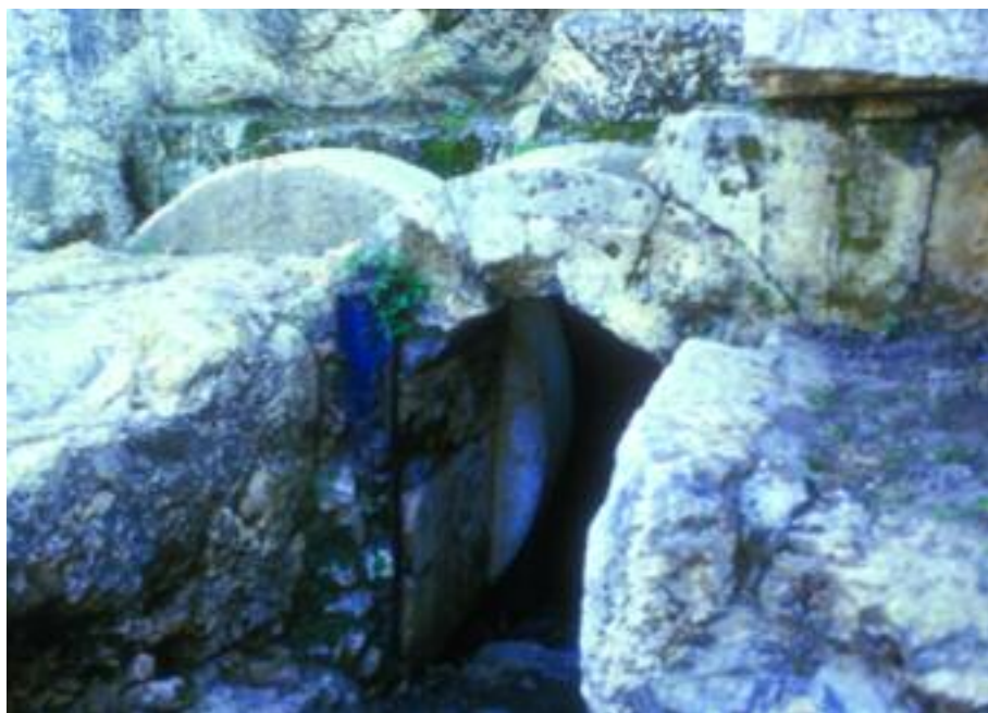
Mormântul familiei lui Irod din Ierusalim. Intrarea a fost închisă cu o piatră similară cu piatra de la mormântul lui Isus.

sugerează că Isus avea un trup fizic, dar în același timp nu Se conforma trupului fizic cunoscut de noi.