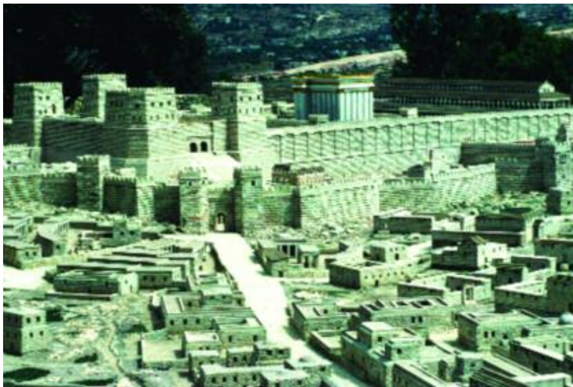
Un model al Templului lui Irod cel Mare din Ierusalim.

fiind nevoiți să plătească o taxă pentru menținerea bunei sale funcționări. Mari sume de bani intrau și ieșeau din Templu, unii dintre evrei preferând să își țină banii acolo ca într-o bancă. Garda Templului nu numai că păzea aceste avuții, ci funcționa ca poliție în Ierusalim. Astfel, Templul era nu numai centrul vieții religioase, ci și centrul vieții politice, economice și sociale. Acolo se desfășurau în mod normal sărbătorile de-a lungul întregului an. În special de Paște, zeci de mii de oameni veneau la Ierusalim, forțându-l pe prefectul roman să aducă mai multe trupe din Cezarea și să împrumute trupe din Siria pentru a menține ordinea. Templul și-a extins prezența peste tot în Palestina prin preoții care lucrau doar temporar la Ierusalim, dar care își petreceau restul timpului acasă, ca învățători sau judecători, fiind conducătorii acelor zone. Acești preoți erau descendenții unor anumite familii de preoți, constituind în același timp, pe lângă o clasă religioasă și una socială aparte.